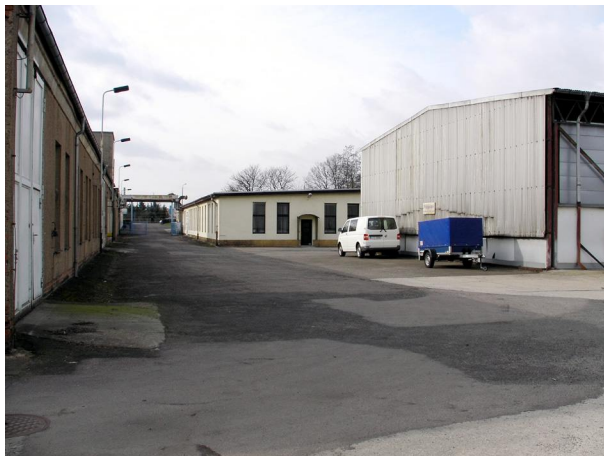
Außenansicht (Blick v. Lagerräum. B)