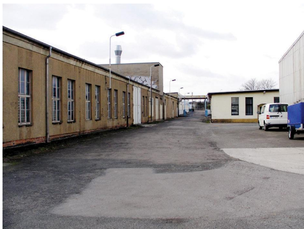
Außenansicht (Blick v. Lagerräume. B)